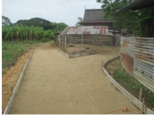
ก่อสร้างถนนคอนกรีตเสริมเหล็ก ม.2 สายบ้านนางเฉลียว บัวสุวรรณ